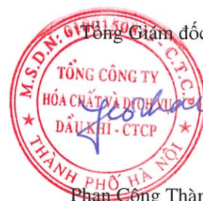
Phan Công Thành

Các thuyết minh đính kèm là bộ phận hợp thành của báo cáo tài chính riêng này