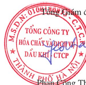
Phan Công Thành

Các thuyết minh đính kèm là bộ phận hợp thành của báo cáo tài chính riêng này