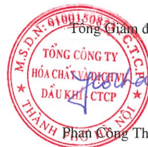
Phan Công Thành

Các thuyết minh đính kèm là bộ phận hợp thành của báo cáo tài chính riêng này